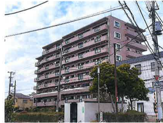
現在リフォーム中