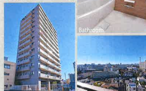
マンション外観 眺望