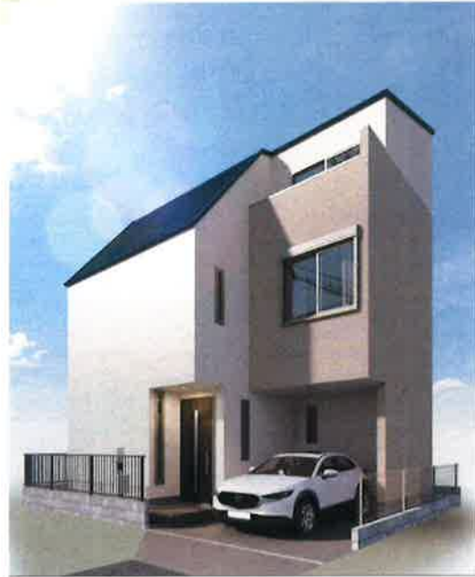
■完成予想図/図面を元に作成したもので実際とは異なる場合がございます。