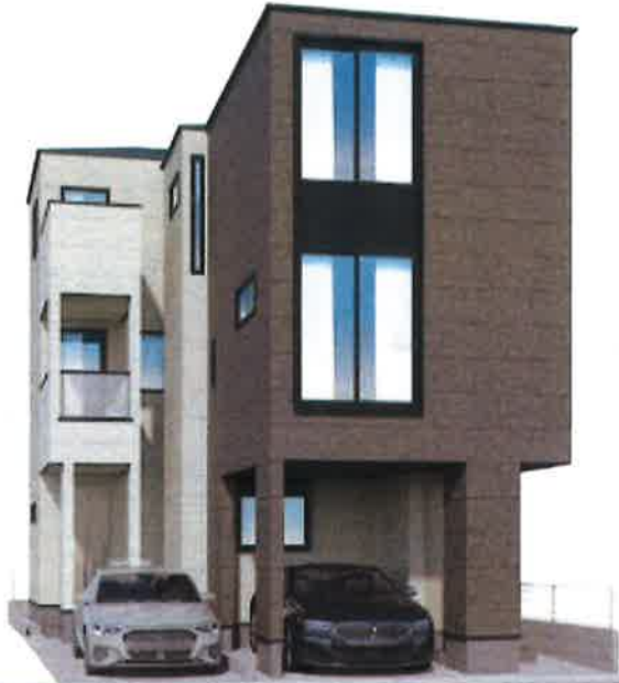
※計画段階の図面を基にイメージ図で実際とは異なります。また今後予告なく変更になる場合があります。