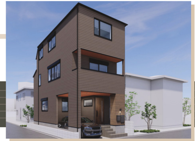
※パースイメージです。実際とは異なります