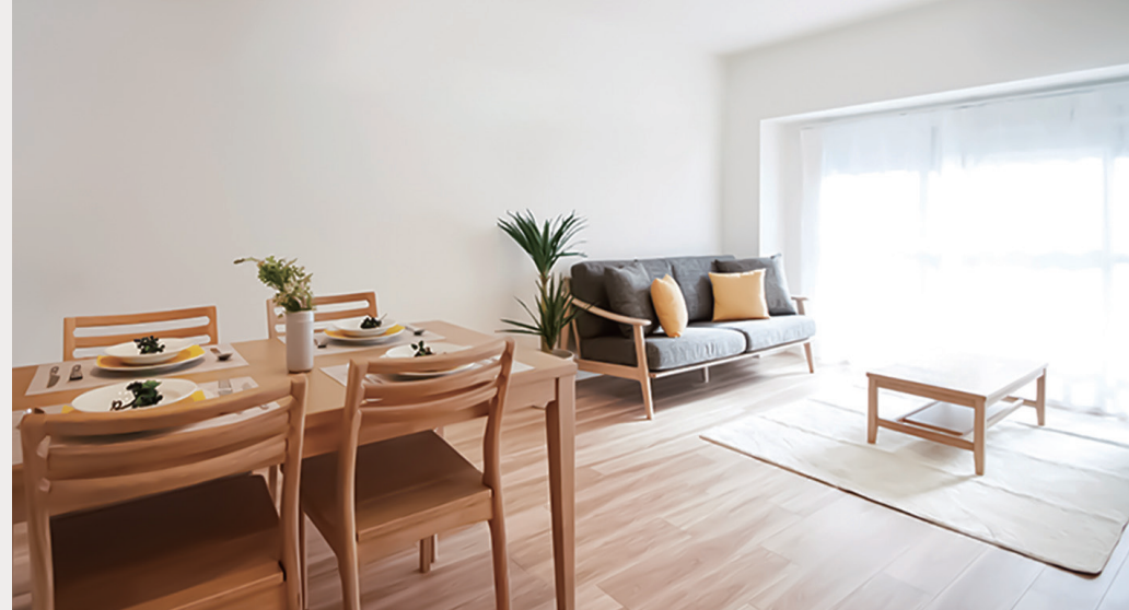
【イメージ写真】写真は一例ですので実際のものとは異なる場合があります。