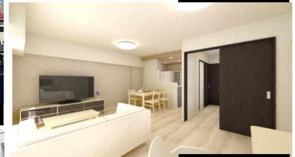
リビングイメージ写真②