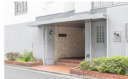
マンション入り口