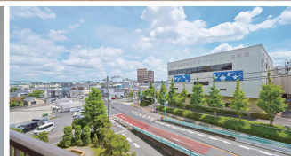
バルコニーからの眺望(2024年8月撮影)