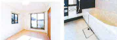
※家具・小物はディスプレイとなります。