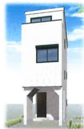
※外観イメージパース