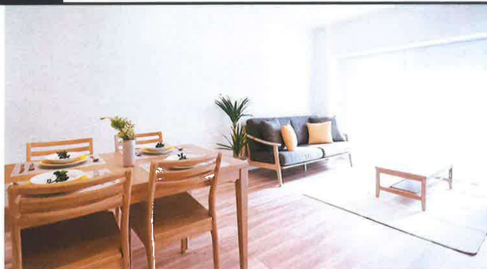
【イメージ写真】写真は一例です。実際の商品は写真と異なる場合があります。