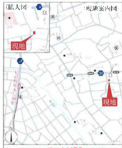
Car navigation 草加市新里町613-10