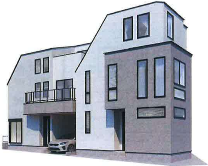
パースはイメージです。実際の仕仕とは異なる場合がございます。