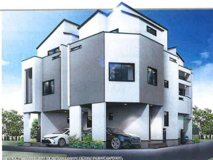
完成後予想図。この写真と実際とは多少異なる場合があります。また、完成後予想図はあくまでイメージです。