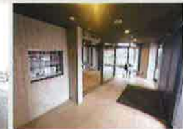
マンションエントランス