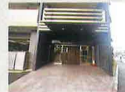
マンションエントランス