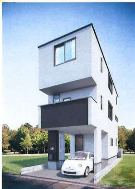
■完成予想図 図面を元に作成したもので実際とは異なる場合がございます。