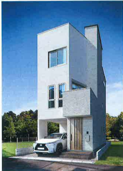
■完成予想図/図面を元に作成したもので実際とは異なる場合がございます。

埼玉高速鉄道線(埼玉スタジアム線)「南鳩ヶ谷」駅 徒歩10分・「鳩ヶ谷」駅 徒歩21分