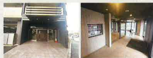
マンションエントランス