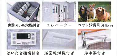
追いだき機能付き 浴室乾燥機付き 浄水器付き ※写真はイメージです。