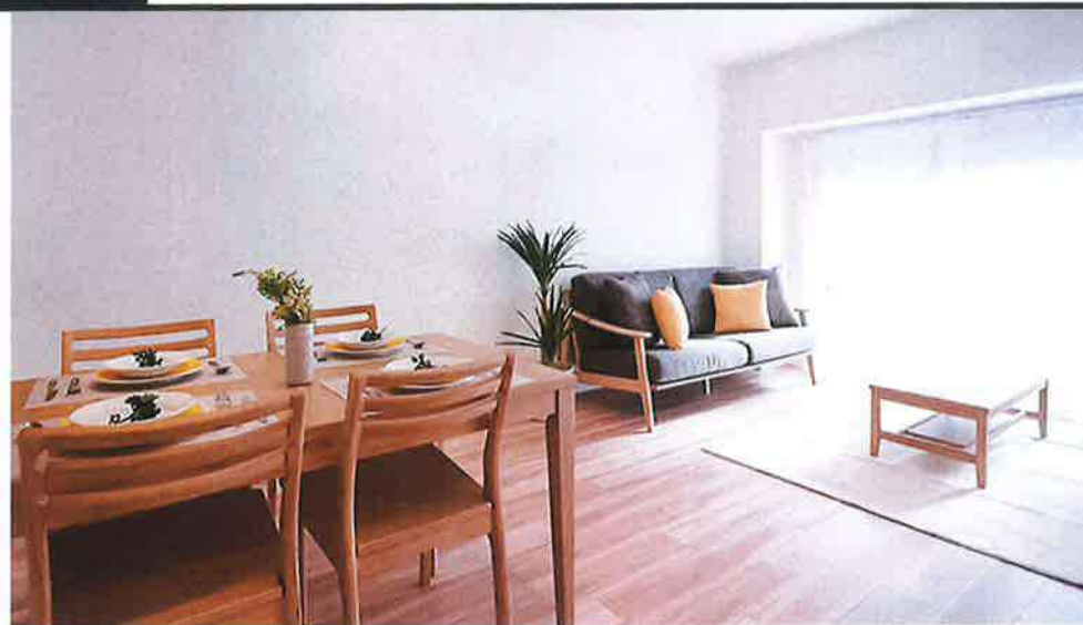
【イメージ写真】写真は一例ですので実際のものとは異なる場合があります。