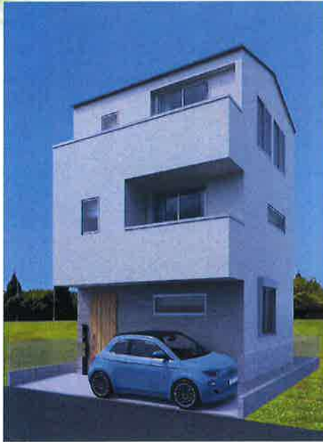
■完成予想図/図面を元に作成したもので実際とは異なる場合がございます。