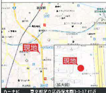
カーナビ 東京都足立区西保木間3-1-17 付近