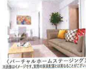
「バーチャルホームステージング」 ※画像はイメージです。実際の家具配置とは異なる場合がございます。