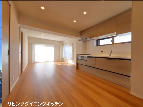
リビングダイニングキッチン