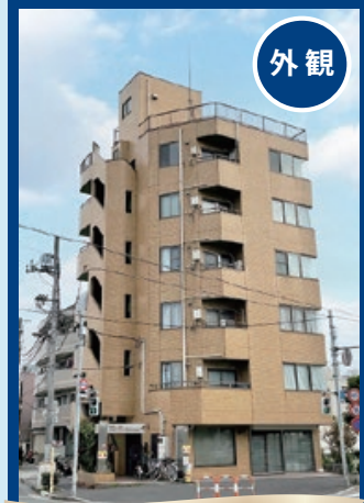
落ち着いたベージュの外観

「フラット35」をご利用の際は事前にお問い合わせ下さい。最終取引時の司法書士は当社指定となります。本図面の記載内容は制作時点のものであり、その後変更になっている場合があります。ご購入・ご契約の前に必ず最新の内容をご確認ください。