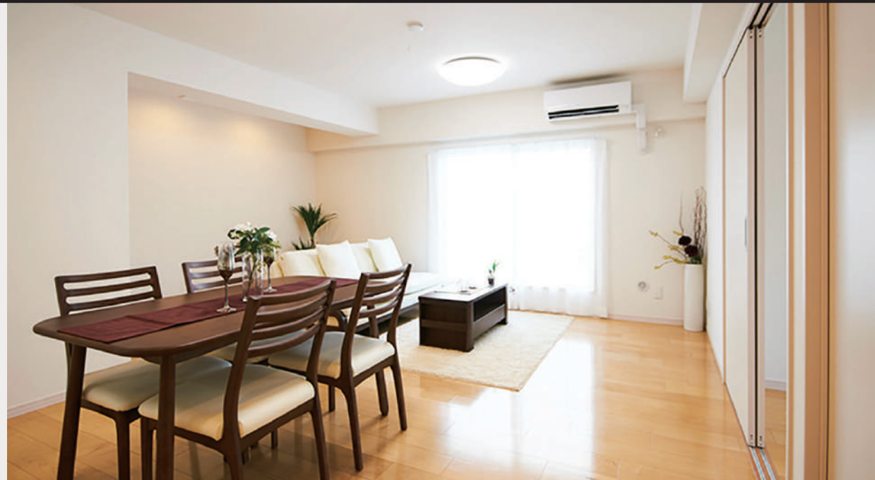
【イメージ写真】写真は一例ですので実際のものとは異なる場合があります。