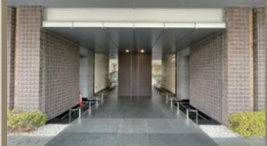
Entrance アクアカフェ / キッチンスタジオ / キッズルーム ヒーリングライブラリー / MTGルーム etc. 完備▶