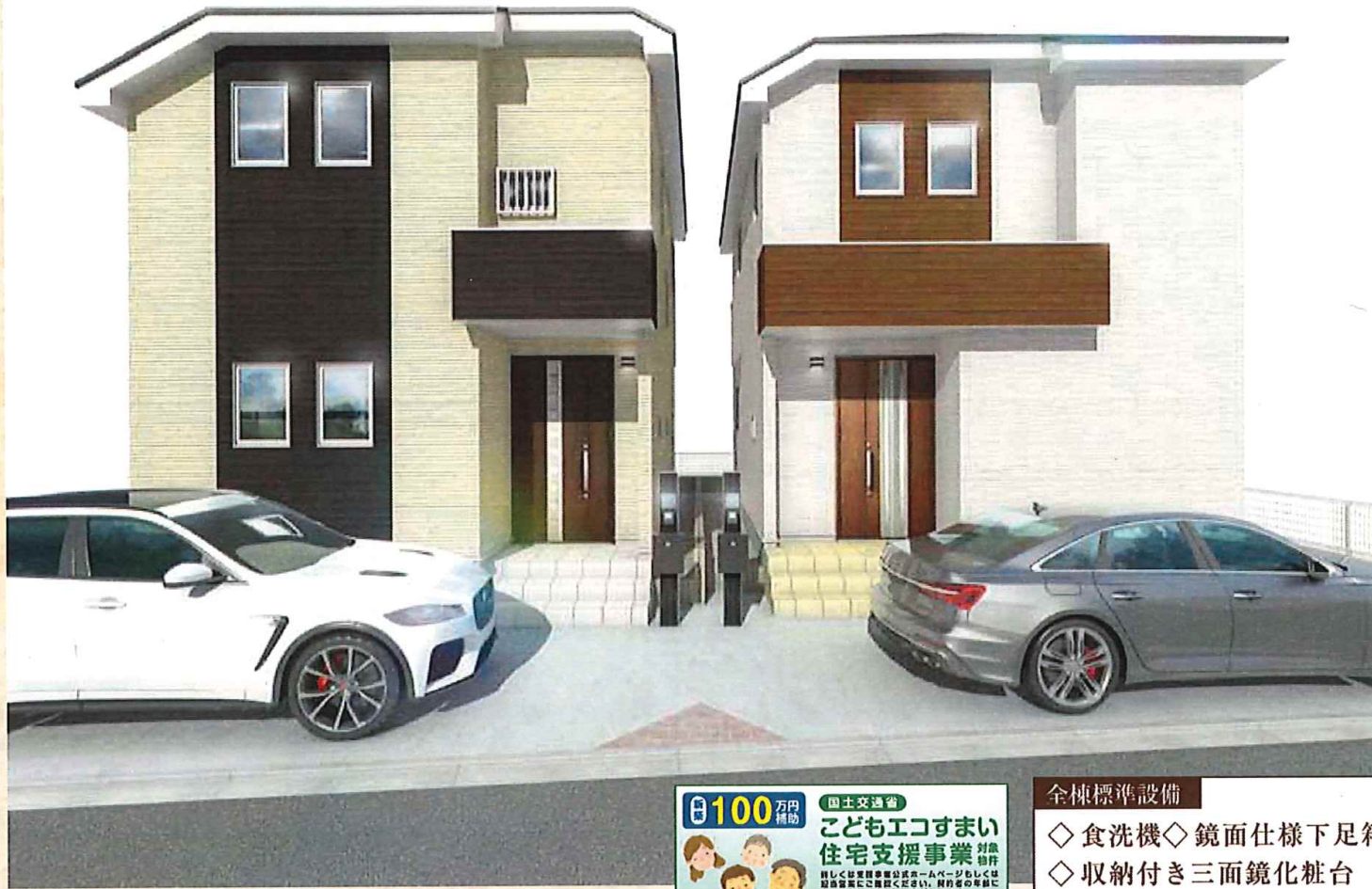
完成予想パース(実際とは多少異なることがあります)