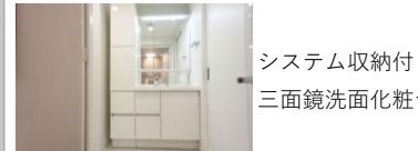
システム収納付き 三面鏡洗面化粧台