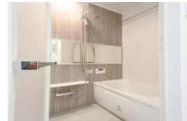
*浴室暖房換気乾燥機付きで半身浴ができる浴槽