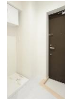
買物・重い荷物の搬入搬出 ゴミ出しに便利な勝手口