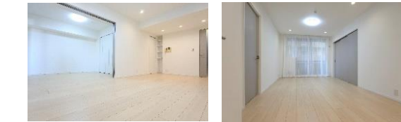
*リビングダイニングに繋がる洋室の引戸を開けると約16.5帖