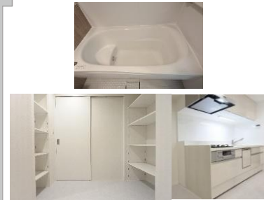
食器洗浄乾燥機付きシステムキッチン 食品庫も増設しましたので収納豊富