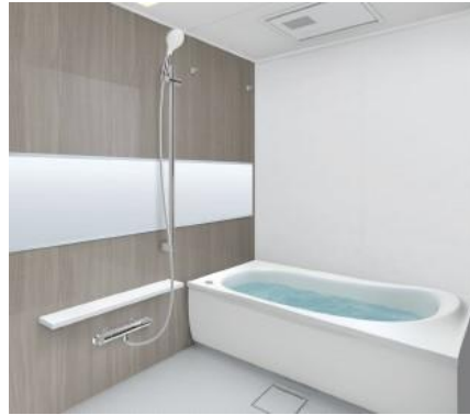
浴室乾燥機付きのユニットバス (施工イメージ図)