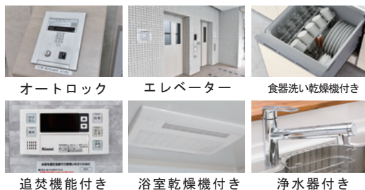
追焚機能付き 浴室乾燥機付き 浄水器付き