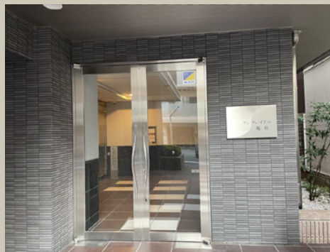
マンションエントランス