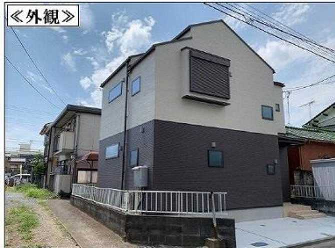
掲載の写真は令和4年9月撮影